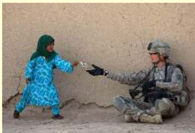
Κοριτσάκι δίνει λουλούδι σε Αμερικανό στρατιώτη