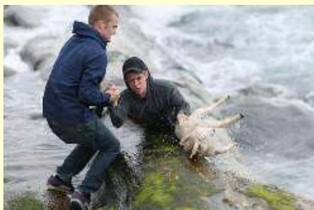
Δύο άντρες με κίνδυνο τη ζωή τους σώζουν ένα κατσικάκι από τη φουρτουνιασμένη θάλασσα