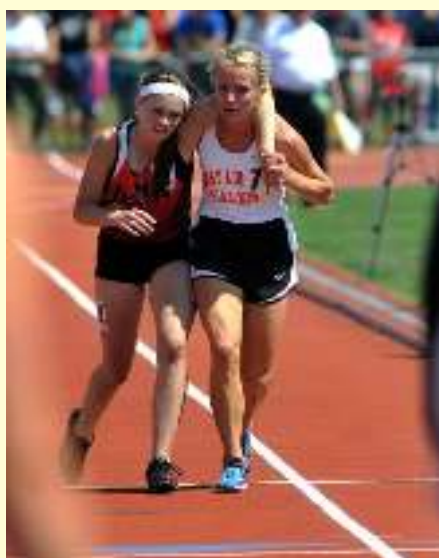
Στο Οχάιο των ΗΠΑ αθλήτρια κουβαλάει συναθλήτριά της, που είχε πέσει κάτω ανήμπορη και την κουβαλάει σχεδόν πάνω της, βοηθώντας την μάλιστα, να τερματίσει πριν από την ίδια.