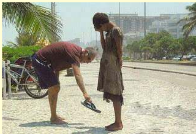
Ένας κύριος βγάζει τις παντόφλες του και τις χαρίζει σε μία άστεγη στο Ρίο ντε Τζανέιρο