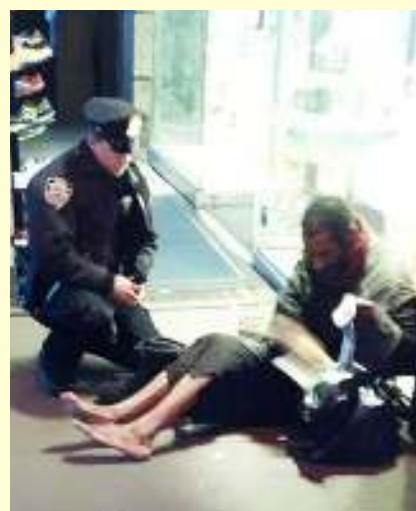
Αστυνομικός χαρίζει ένα ζευγάρι κάλτσες σε άστεγο