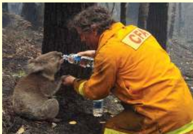
Πυροσβέστης δίνει νερό στο κοάλα, μετά την καταστροφική πυρκαγιά που έπληξε την Αυστραλία το 2009